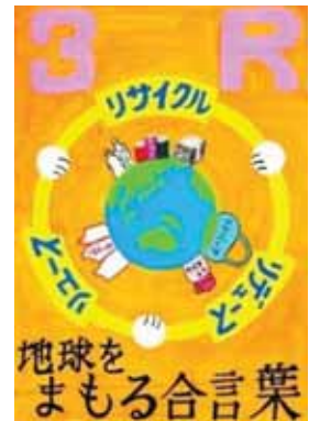
香川県善通寺市立吉原小学校3年