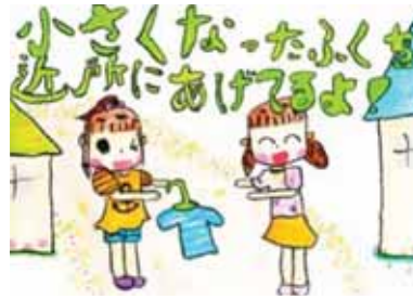
愛知県半田市立岩滑小学校3年