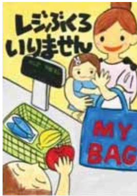
茨城県下妻市立総上小学4年