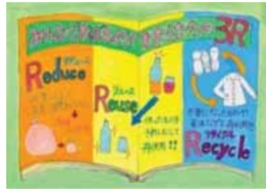
埼玉県新座市立東北小学校4年