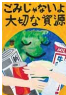
香川県高松市立一宮小学校6年