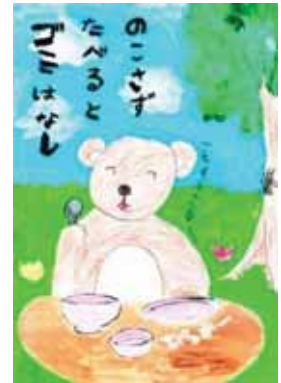
愛知県小牧市立桃ヶ丘小学校1年