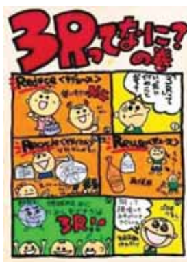
熊本県八代市立第四中学校2年