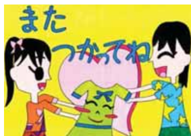
愛知県安城市立安城中部小学校3年