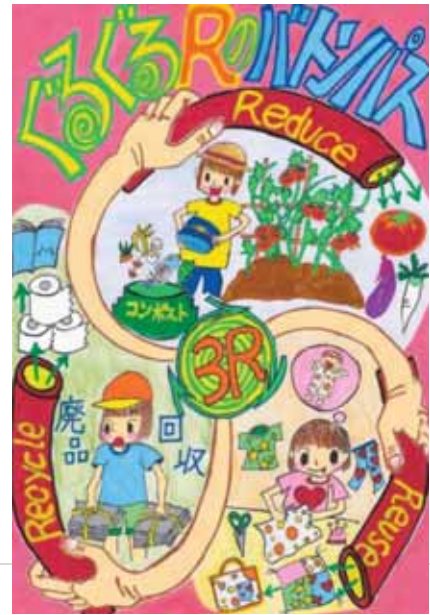
山口県周南市立秋月小学校5年