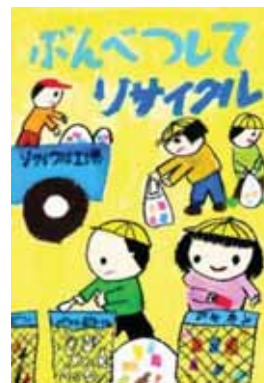
群馬県館林市立第五小学校1年