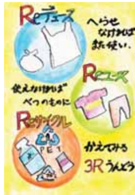
栃木県佐野市立吾妻小学校3年