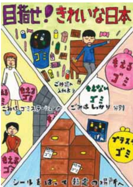
愛知県安城市立錦町小学校5年