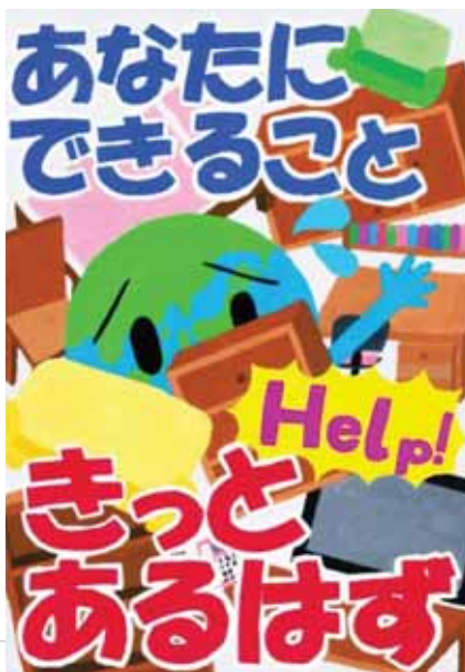
愛知県半田市立乙川中学校3年