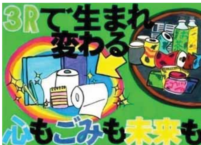
中学生の部 最優秀賞作品 茨城県牛久市立下根中学校1年生