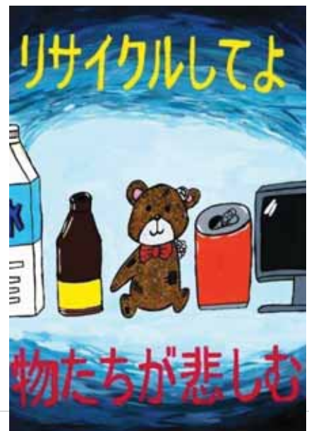
岩手県大船渡市立綾里中学校1年