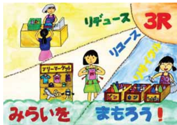
愛知県安城市立丈山小学校3年