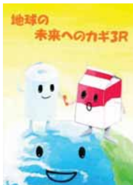
宮城県石巻市立山下中学校2年