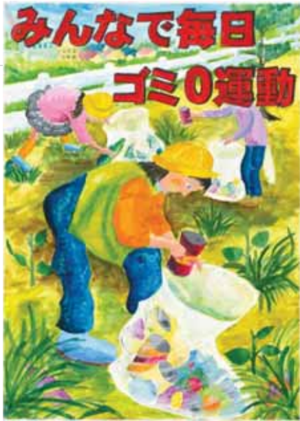
千葉県茂原市立茂原小学校5年