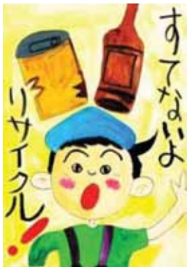
茨城県常陸大宮市立緒川小学校3年