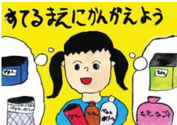
愛知県安城市立三河安城小学校1年