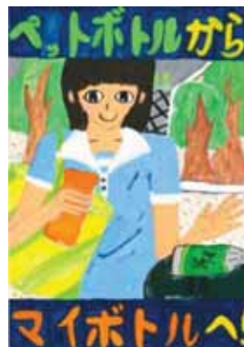
愛知県豊橋市立二川小学校6年