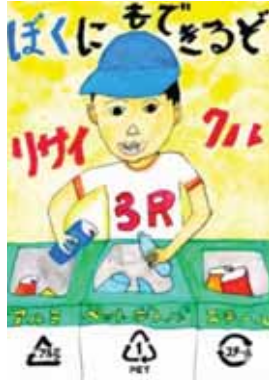
茨城県取手市立寺原小学校3年