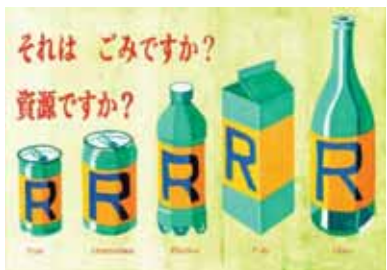
滋賀県大津市立仰木中学校2年