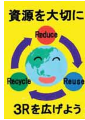
静岡県袋井市立袋井南中学校3年