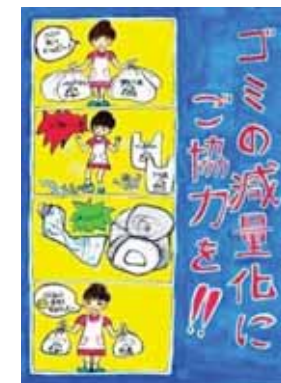
群馬県伊勢崎市立北第二小学校3年