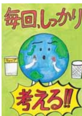
愛知県安城市立里町立学校6年