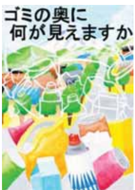
愛知県安城市立安祥中学校3年