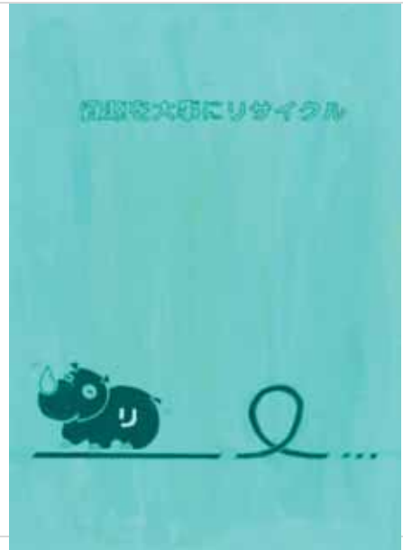
岐阜県羽島郡笠松町立笠松中学校3年