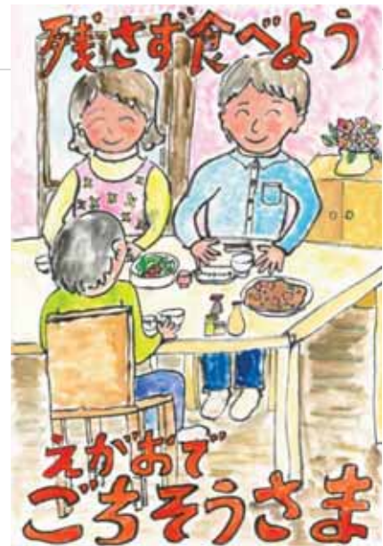
愛媛県大洲市立久米小学校6年