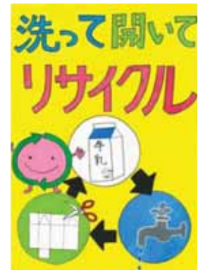
千葉県野田市立関宿中央小学校6年