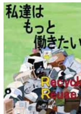
愛媛県伊予郡松前町立松前中学校2年