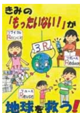
愛知県豊橋市立東田小学校6年