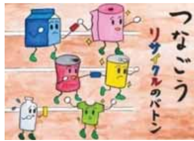
愛知県西尾市立一色西部小学校4年