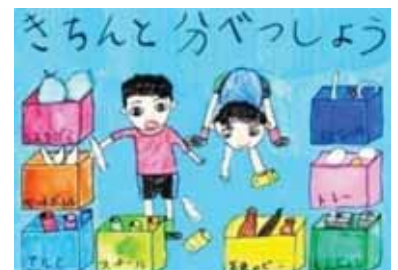
茨城県下妻市立騰波ノ江小学校2年