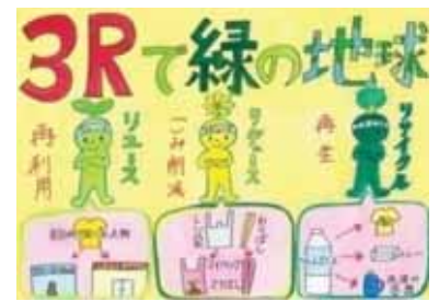
山形県天童市立長岡小学校6年