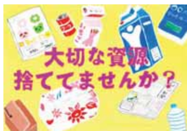
愛知県豊橋市立中部中学校2年