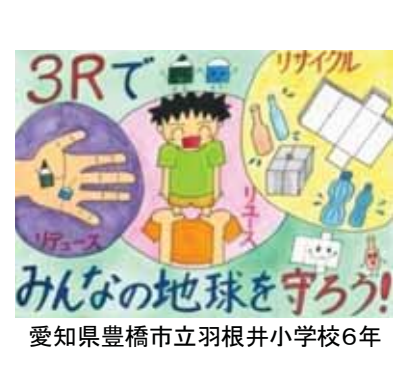
愛知県豊橋市立羽根井小学校6年