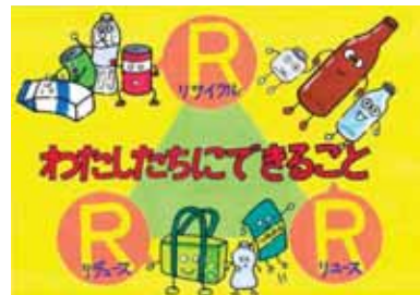
群馬県佐波郡玉村町立玉村中学校2年