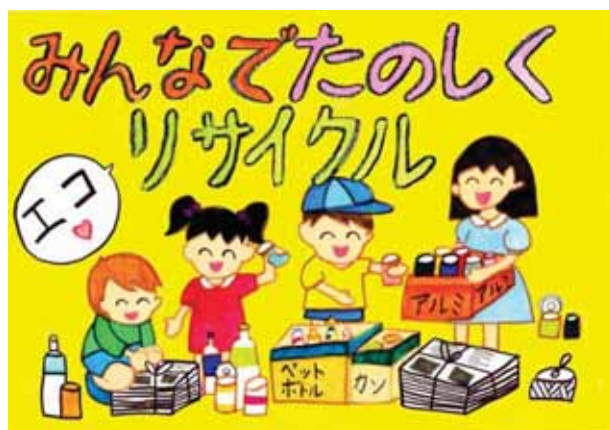
愛知県知多市立旭南小学校3年