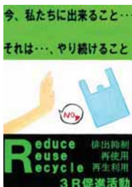
茨城県牛久市立牛久第一中学校1年