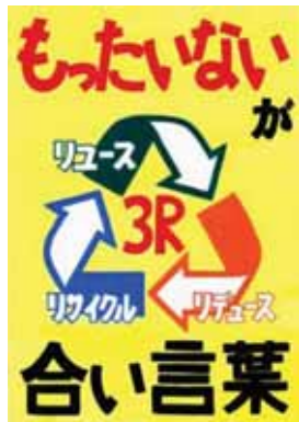
愛知県愛西市立立田中学校1年