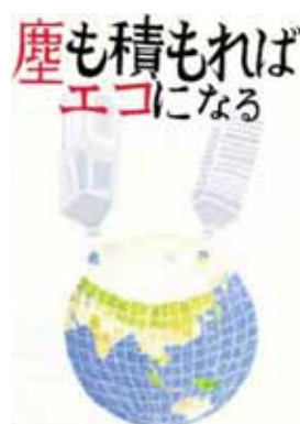
群馬県伊勢崎市立境北中学校1年