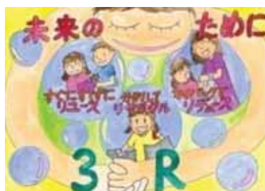
愛媛県四国中央市立上分小学校4年