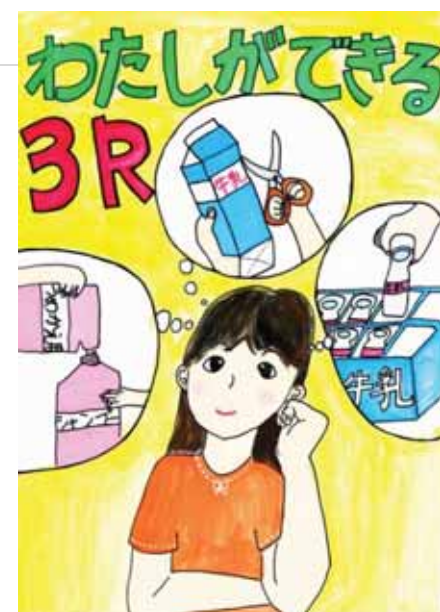
愛知県小牧市立桃ヶ丘小学校3年