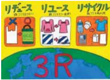
茨城県鉾田市立徳宿小学校6年