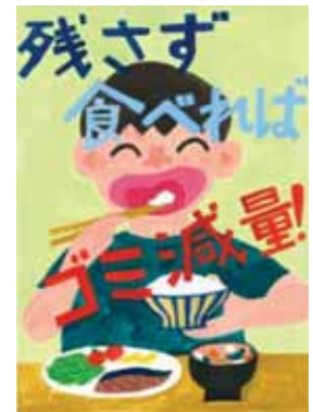
愛知県安城市立高棚小学校6年