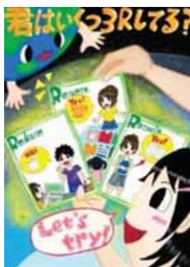
宮城県石巻市立住吉中学校3年