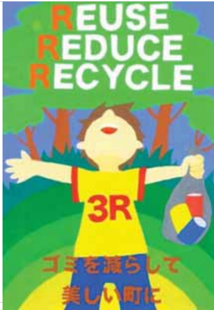
愛媛県今治市立近見中学校3年