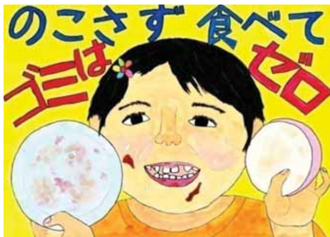
小学校低学年の部 最優秀賞作品 愛知県日進市立赤池小学校3年生