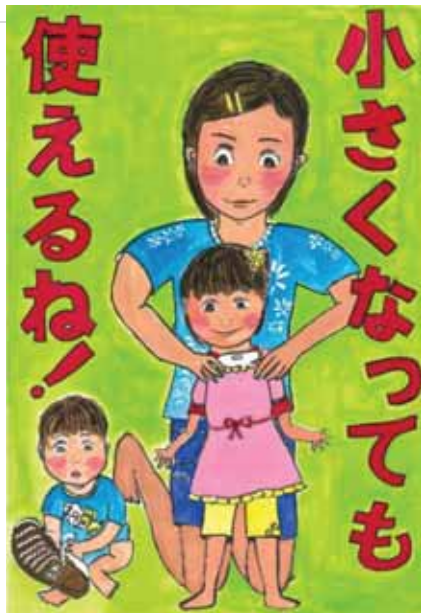
愛媛県西予市立狩江小学校5年