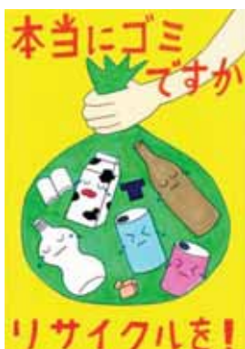
愛知県知多市立旭北小学校3年