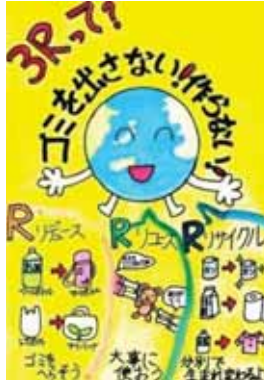
兵庫県尼崎市立浜田小学校3年