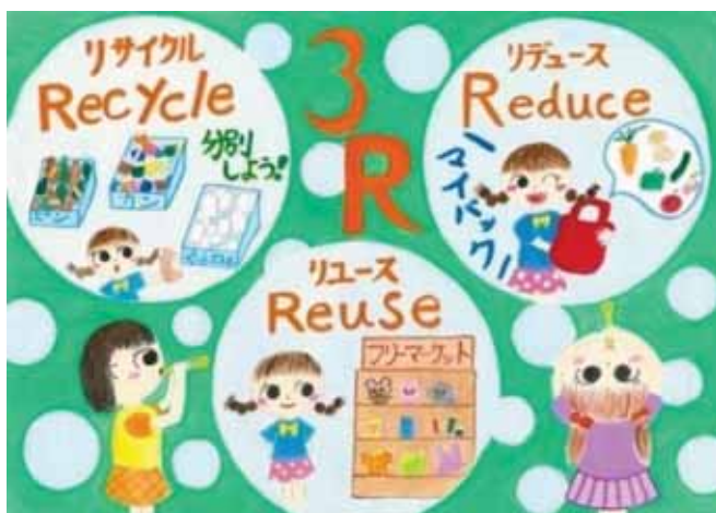
小学校高学年の部 最優秀賞作品 栃木県真岡市立中村東小学校6年生