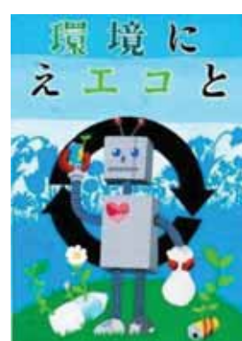
富山県富山市立上滝中学校2年