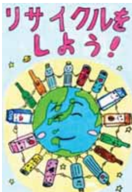
愛媛県今治市立伯方小学校3年