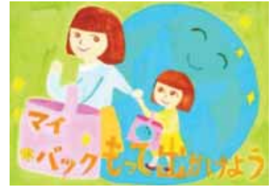
香川県高松市立古高松南小学2年