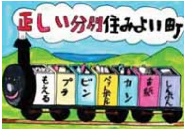
愛知県安城市立錦町小学校3年