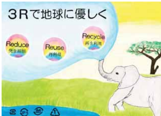
愛媛県伊予郡松前町立岡田中学校1年