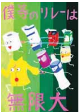
愛知県小牧市立応時中学校1年