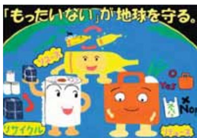
愛知県刈谷市立雁が音中学校2年