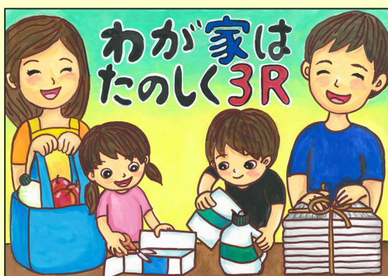
令和3年度 各部門ごとの最優秀作品